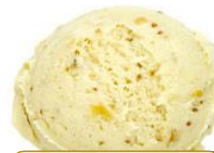
モッツアレラチーズ & クランベリー