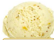
モッツアレラチーズ & クランベリー