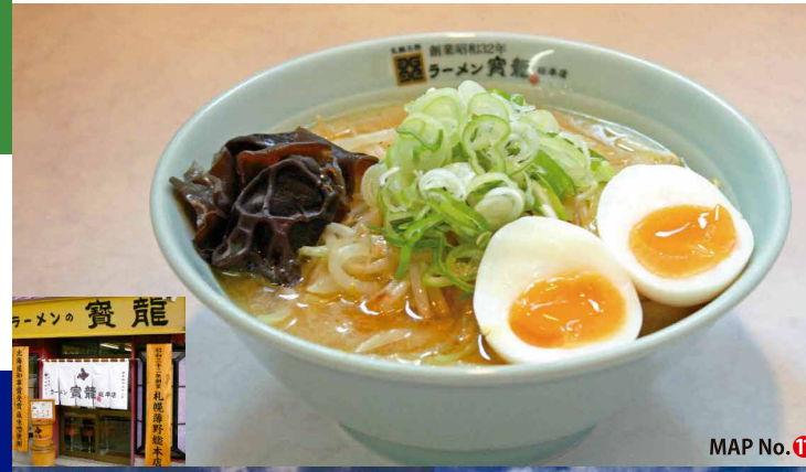
MAP No. 11