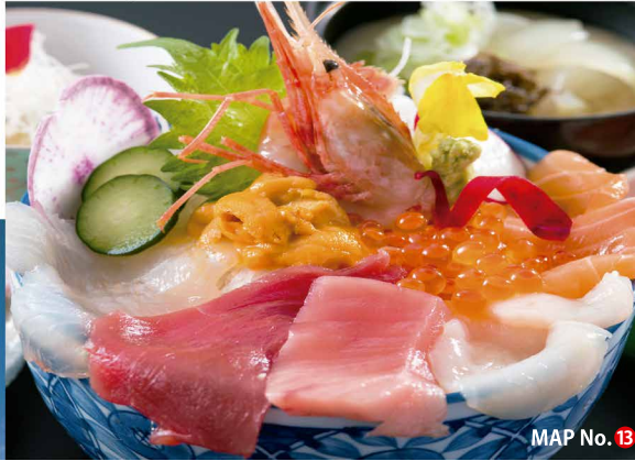
MAP No. 13