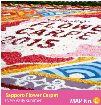
Sapporo Flower Carpet Every early summer