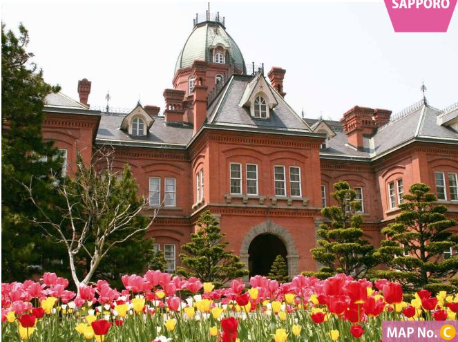
MAP No. C